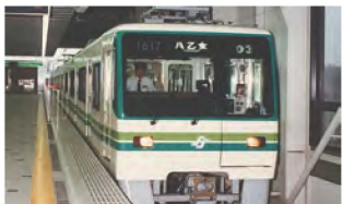
昭和 62 年南北線宮沢駅