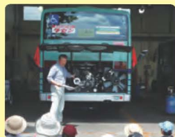
夏休み親子探検ツアー