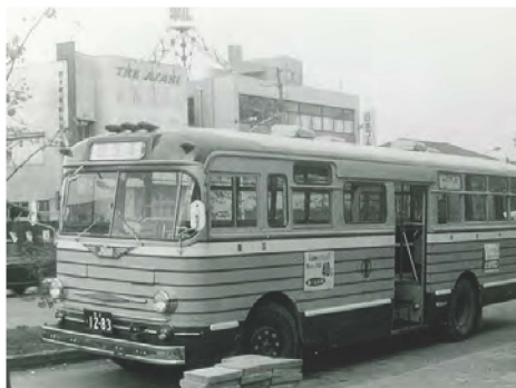
昭和 30 年代広瀬通