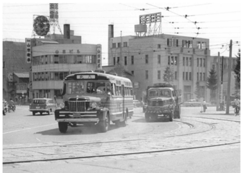
昭和 30 年代勾当台公園周辺