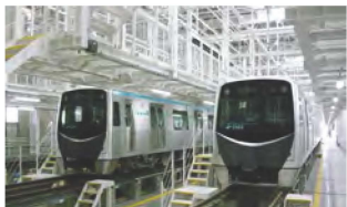
平成 27 年荒井車両基地