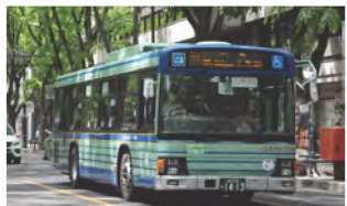
平成 29 年定禅寺通