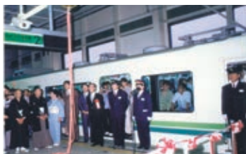
南北線開業式典 (昭和62年)