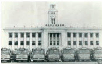
仙台市役所前にて (昭和36年)