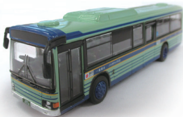
ダイキャスト製1/80 フェイスフルバスシリーズ No.18 仙台市交通局

株式会社トレンより仙台市営バスをモデルとしたミニカーが11月24日に発売されました。玩具専門店や家電量販店等でお買い求めください。