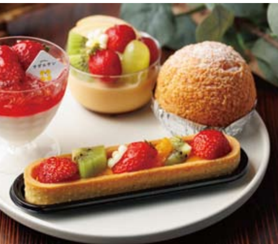
「季節のフルーツタルト」(写真手前・594円)には、春先はイチゴ、6月はサクランボ、夏はドウといった寒河江市産の旬の果物を使用。季節に応じて新たな出会いがある人気商品だ

八幡一丁目バス停も近くにある。訪れる際は店の擬人化キャラ「飯谷よし子」が描かれたのぼりを目印に!