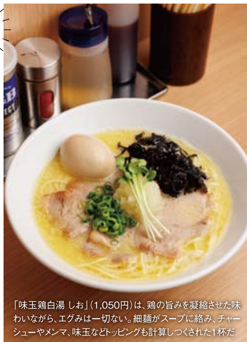
「味玉鶏白湯しお」(1,050円)は、鶏の旨みを凝縮させた味わいながら、エグみは一切ない。細麺がスープに絡み、チャーシューやメンマ、味玉などトッピングも計算しつくされた1杯だ

〒仙台市青葉区八幡1-4-26 ブランドビル八幡1F ☎022-397-6578 🕒11:30~14:30、17:30~21:30、 土・日曜11:30~14:30、17:00~21:00 ☎火曜、第4月曜