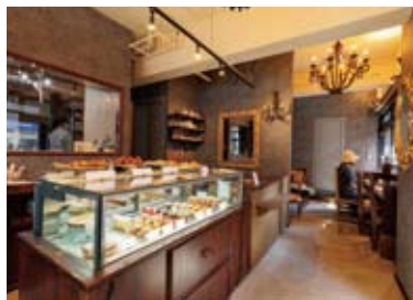
ゆったりとした店内には、きらびやかなスイーツや焼菓子が並ぶ。イトインスペースも用意