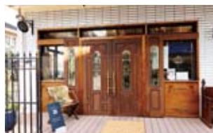
まるで老舗のような重厚感のあるアンティーク調の扉。落ち着いた雰囲気も魅力のひとつ