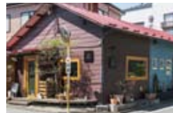
赤い屋根が印象的。軒先に立つ木がナチュラルで柔らかな空気を醸し出している。火・水曜は休み