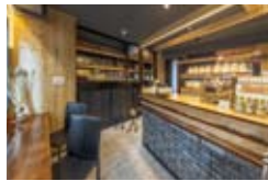
温かみのある店内には、自家製天然酵母など、こだわりの素材を使った食パンが並ぶ

〒980-0001 仙台市宮城野区小田原弓ノ町102-23 TAKEビル1F ☎022-292-0770