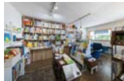
絵本がずらり。珍しい仕掛け絵本なども並ぶ。好みの1冊を見つけてみよう

〒980-0001 仙台市宮城野区小田原1-9-28 ☎090-2991-0700