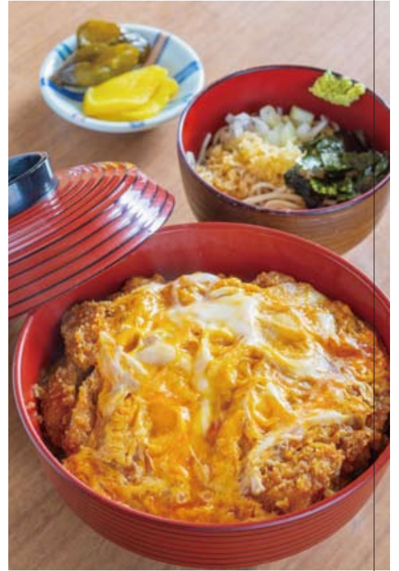
一番人気の「カツ丼」(850円)。注文後に揚げるカツはサクサク! 卵はトロトロ!