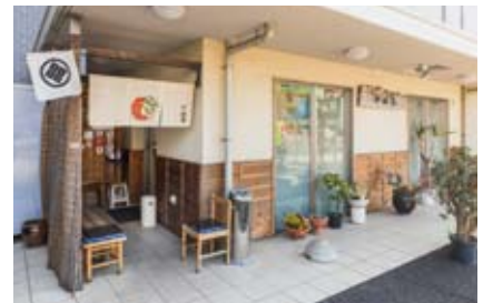
老舗の雰囲気が漂う、木の看板が目印。何十年も通うファンがいるほどの人気店