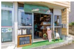
'21年にオープン。『仙台市ガス局』の近くに店を構え、早くも地元民から愛されている