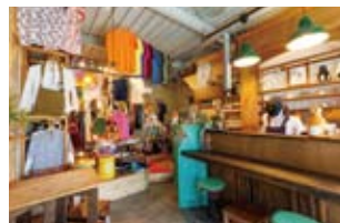
古着屋『mother of pearl』が同居。カフェメニューを待っている間に掘り出し物を探すのも楽しい