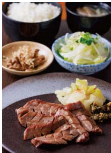
看板商品の「昆布メ厚切り牛タン定食」(1,600円)。昆布で煮ること、より弾力ある歯応えに

仙台市青葉区東照宮2-2-16 ☎022-341-9833 https://lumos-general-store.com