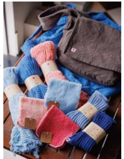
バッグやストール、ハンカチなど多彩な倉敷染アイテムが揃う(550円~)