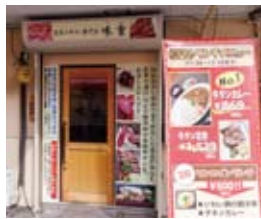
ワンコインで食べられるランチメニューが人気。夜は居酒屋として営業する