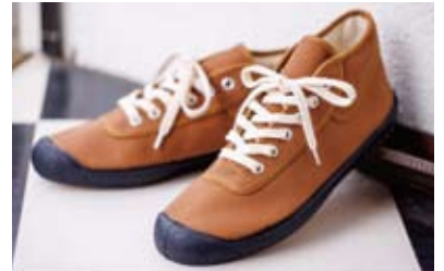
ブラウンカラーが可愛い「INN-STANT」の「ミドルカット スニーカー(茶/39)」(8,800円)