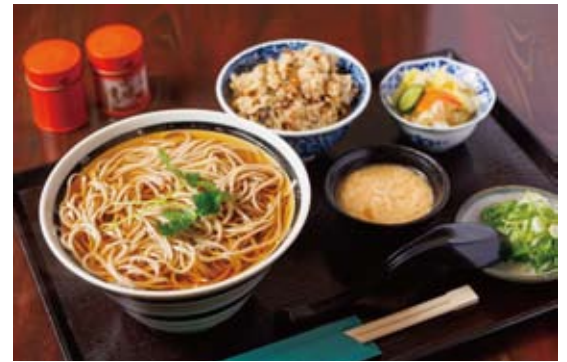
朝11時までの「朝食セット」(800円)は日替りご飯、とろろ、お新香付き。そば、うどんどちらも選べる

「120円パッ区」乗車券に付いてくるクーポン提示で... 特典 「ウーロン茶」を1杯サービス ※食事を注文した人に限る