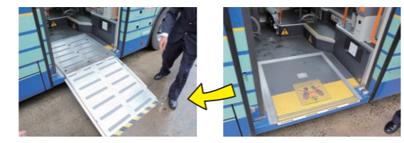
車椅子用のスロープが登場! バス乗車口の床を引き出すと...

さまざまな人が利用する仙台市営バス。身体が不自由な方でもスムーズに乗り降りできる工夫が盛りだくさん。今回は車椅子の方がバスに乗り降りする際の体験を行いました。