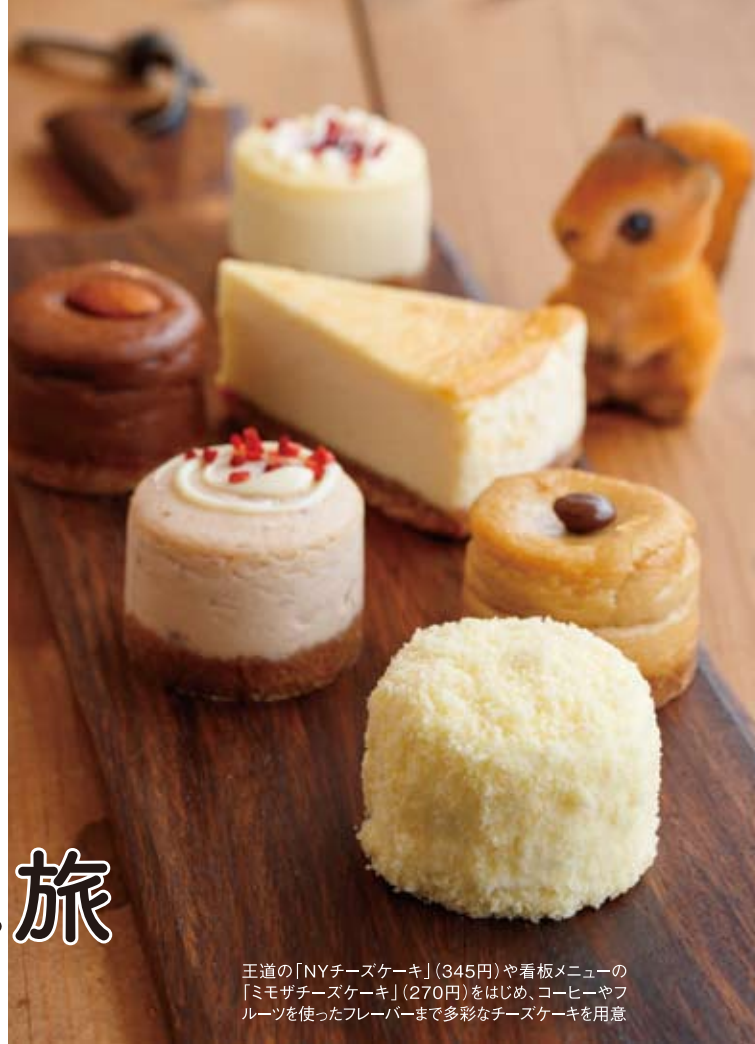
王道の「NYチーズケーキ」(345円)や看板メニューの「ミモザチーズケーキ」(270円)をはじめ、コーヒーやフルーツを使ったフレーバーまで多彩なチーズケーキを用意