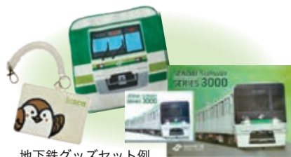
地下鉄グッズセット例

せんだいオンライン申請サービスまたは郵送（回答用紙は区役所・地下鉄駅等で配布）で回答してください。