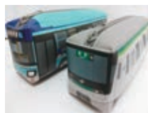
ベンケース (2種) 各 1,500 円 (税込)