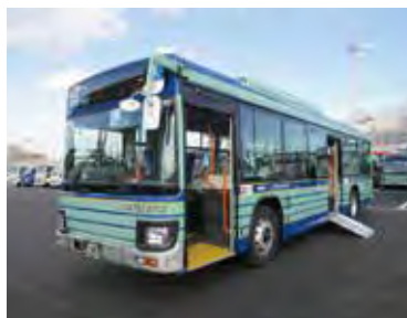
ノンステップバス

今後、更なる費用削減や増客・増収の取り組み、資産の有効活用などを進めていきます。