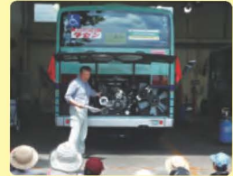
夏休み親子探検ツアー