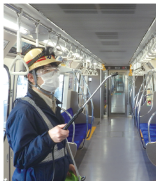
定期的な消毒の様子

これからも、仙台市交通局ではお客様に安心してご利用いただけるよう感染症対策に努めてまいります。今後もお出かけの際にはぜひ市バス・地下鉄をご利用ください!